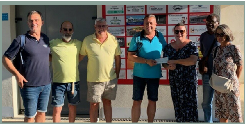
Organisation d'un tournoi de pétanque par la pétanque Moursoise au profit de Coala26