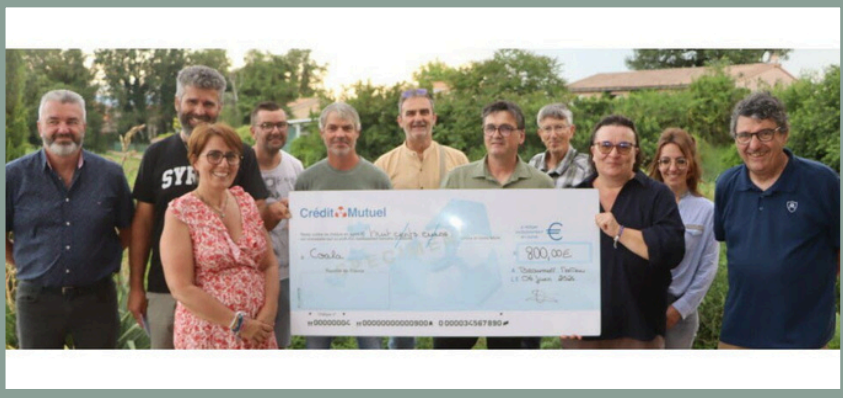
Soutien à Coala26 lors du Grand Week-End des Crozes-Hermitage