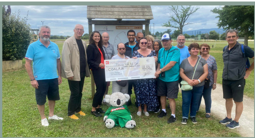
Remise d'un chèque par la Caisse d'Epargne lors du Coathlon final