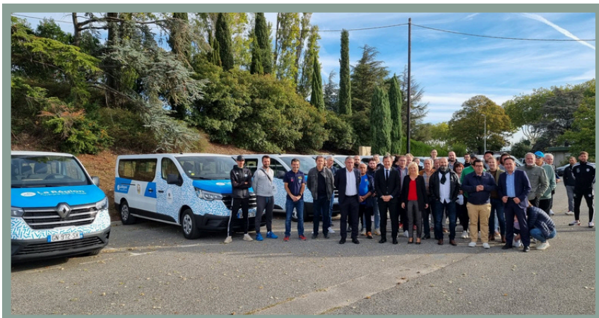
Remise d'un minibus par la Région AURA