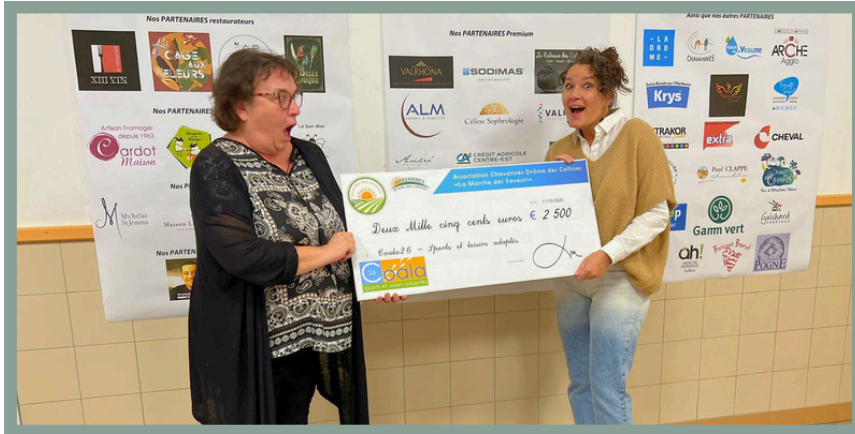
L'association Chavannes Drôme des Collines, organisatrice de "La Marche des Saveurs"